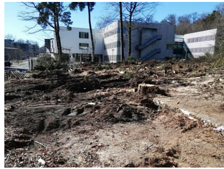
Biergarten nach der Rodung