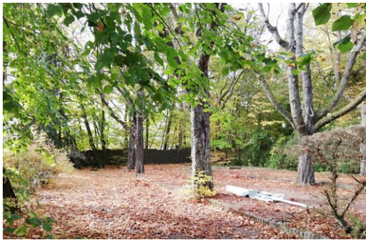
Biergarten vor der Rodung

Auch die Tage der Gaststätte „Stuhlsätzenhaus“ im Osten des Unigeländes sind gezählt: Die Abrissarbeiten stehen unmittelbar bevor. Der vor allem im Sommer von Studenten, Mitarbeitern der Uni und der saarl. Bevölkerung gerne besuchte Biergarten mit 80 Jahre altem Kastanien-Baumbestand wurde bereits gerodet.